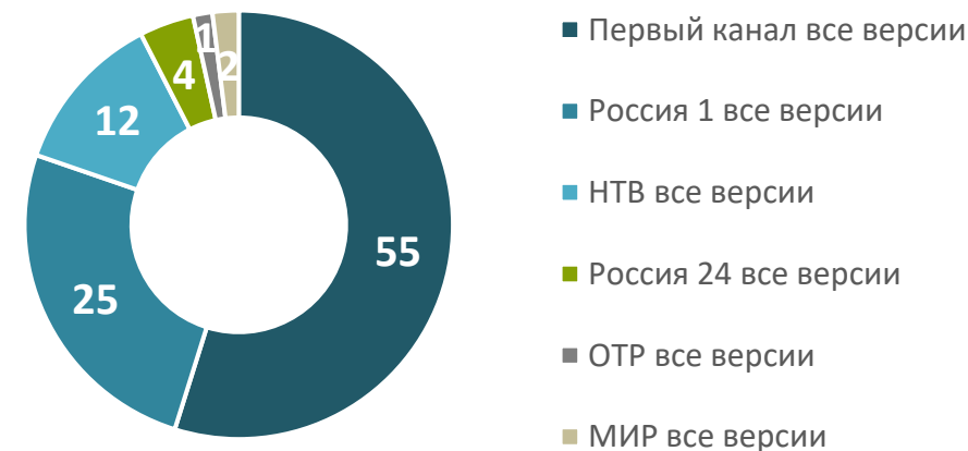
Распределение зрителей пресс-конференции по каналам, %

Абоненты Триколор 4+. Трансляция Пресс-конференции Президента 23.12.2021 с 12:00 до 16:09. Топ по каналам. Предварительные данные. Анализ всех версий всех каналов, где шла прямая трансляция Прямой линии.